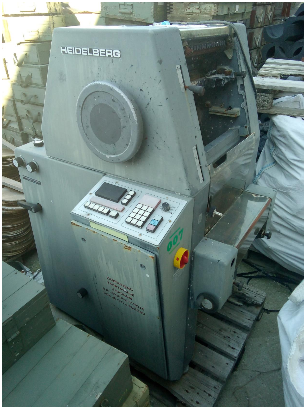
Haidelberg stroj za štampanje -nekomletan, izvan funkcije, na otvorenom