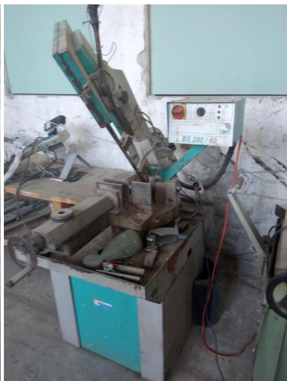
Lisna pila za metal BS 280/60