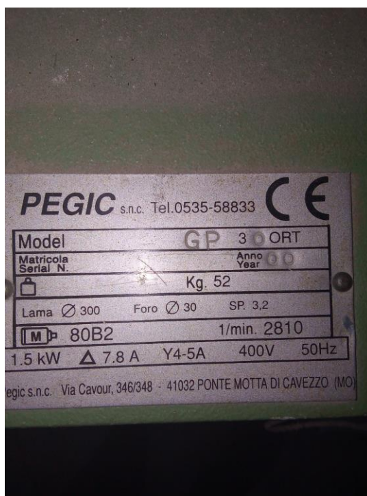
Potezni cirkular PEGIC GP 30 ORT