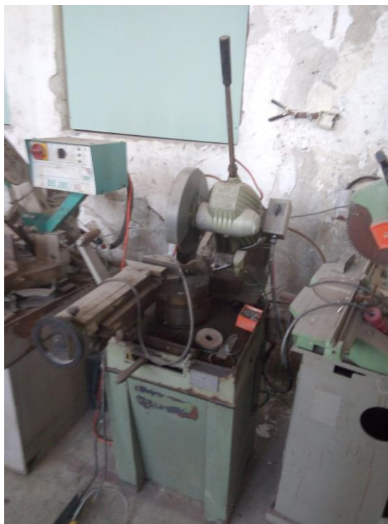
Potezni cirkular SUPER BROWN SPECIAL